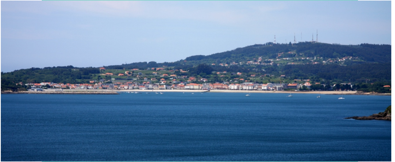
Ares, vila pesqueira e turística asentada no leste da enseada entre a desembocadura do rego Vieira ou Xunqueira e a punta do Castelo. Detrás o monte Faro co cumo da Bailadora.