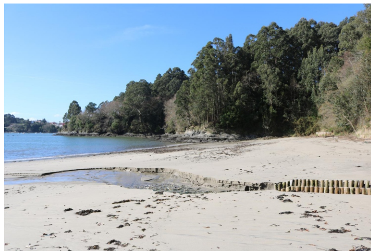
Praia do Río Sandeo

Comezamos en Redes , baixamos do aparcamento á praia de Area Morta e volvemos para pasar polo peirao e seguir ata a punta do Castelo . Volvendo do castelo collemos o primeiro desvío á esquerda para achegarnos á praia de Sabadelle que se atopa a uns 500 m, no remate dun desvío á esquerda que atopamos a uns 300 m. Da praia de Sabadelle volvemos á estrada porque non é posible seguir pola beira, impídeo o relevo, a falta de carreiros e os peches das parcelas; e seguimos por ela ata chegar a un cruce onde collemos á esquerda, e uns 200 m adiante a outro cruce onde volvemos coller á esquerda. Aquí podemos decidir se camiñamos uns 800 m para achegarnos á punta do Mourón que teríamos que desandar logo para coller, á esquerda, a estrada que nos leva ao Raso, ou só camiñar un cento de metros e coller o desvío á dereita, que nos leva á praia do Raso . Desde O Raso ata o remate do percorrido todo se fai doado, se a marea está moi baixa podemos facelo case todo pola area, se non percorremos pola area as praias do Raso e da Campa , no remate desta última subimos pola escaleira para coller o camiño á esquerda, logo estrada, que cruzando o Castro nos leva á praia da Ciscada . Desde a Ciscada polo paseo da ribeira percorremos o litoral da vila de Ares (praia e porto) e imos ata o final do traxecto.