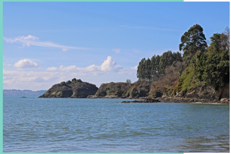
O Mourón desde a praia de Sabadelle.