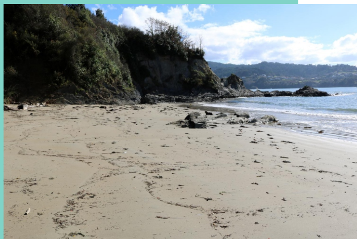
Praia de Sabadelle e punta da Agra