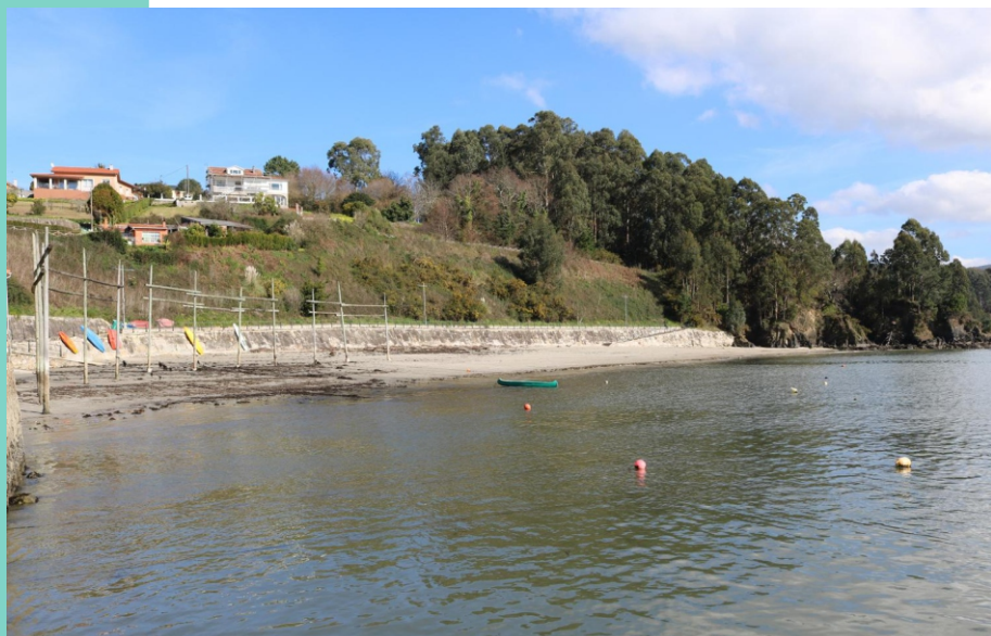
Praia de Area Morta (Redes)