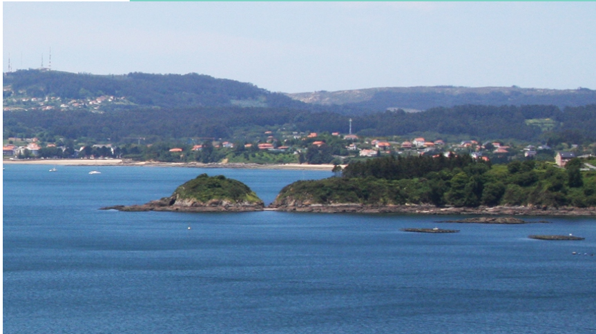
Punta e illa Mourón