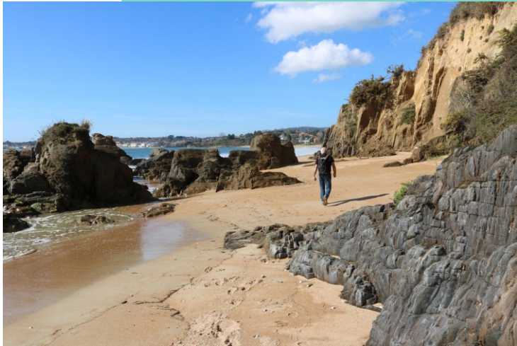
Rochas entre as praias da Campa e O Raso