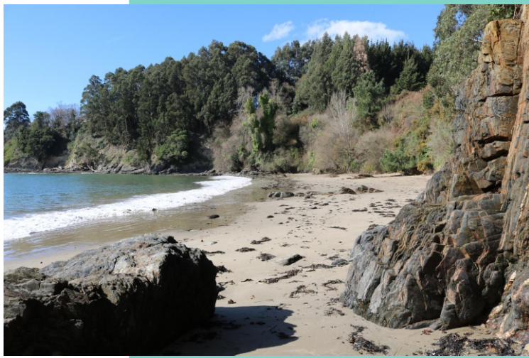
Praia de Sabadelle