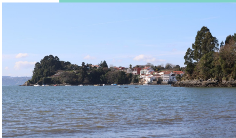
Punta do Castelo (Redes)