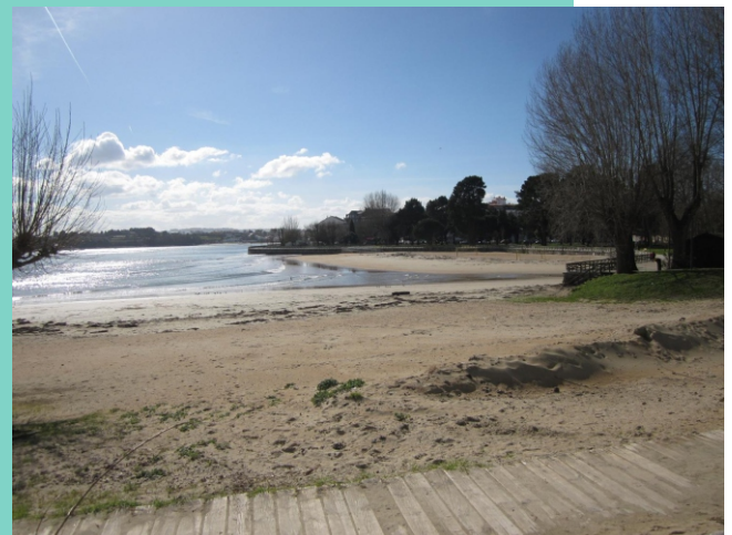
Praia da Cascada