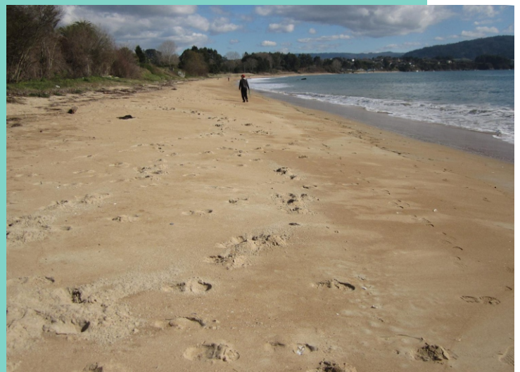
Praia de Seselle (A Campa)