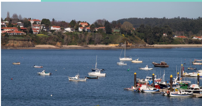
Punta e praias da Campa (O Castro)